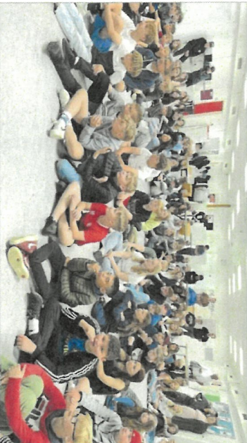
Forhandling om de senere mødetid.

En lille bekymring Der er bare én lille bekymring, og det er, at nogle elever måske vil have svært ved at komme til skole tidligt om morgenen. Men det kan løses ved at sørge for, at eleverne får nok søvn og er veludhvilede om morgenen.