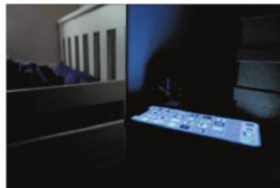
Unge får for lidt søvn. Det skyldes dog ikke kun mødetiderne på skolerne.

- Det er suverænt. For det handler ikke om at lægge timerne på et andet tidspunkt og fratage de unge noget af deres sociale tid og fritid. De kan sagtens få fri på samme tid som for, selvom de møder senere, fordi deres læringspotentiale øges, når de er der. De behøver ikke nødvendigvis flere timer, fortæller han.