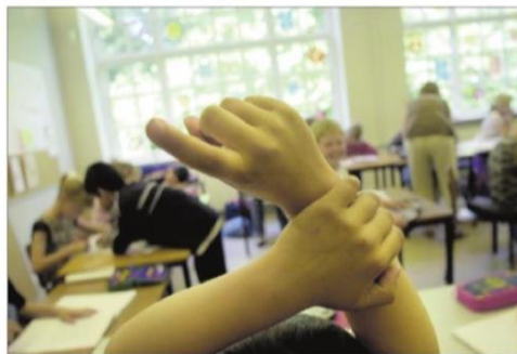
Teenagere er mere læringsparate, hvis de får lov at sove længere om morgenen, fortæller søvneksperter.