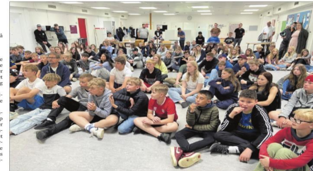
Torsdag fik de elever, der efter sommerferien skal gå i 6. til og med 9. klasse på Kildebjergskolen besked om et nyt tiltag til senere mødetid. Foto: Christina Quist

Hun forklarer, at hun håber, tiltaget vil være en hjælp for de elever, der i dag vælger at blive hjemme hele skoledagen, hvis de ikke er kommet op til den første time om morgenen. De kan måske bedre overskue at tage i skole, hvis de først skal møde ved 9-tiden.